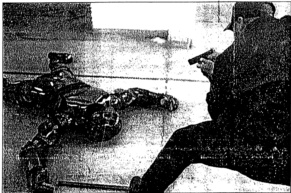
Toutes les techniques d'arrestation sont évoquées... mais elles sont réservées aux policiers